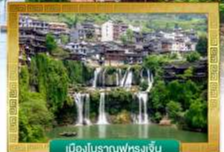
เมืองโบราณฟุ่หลงเจิน