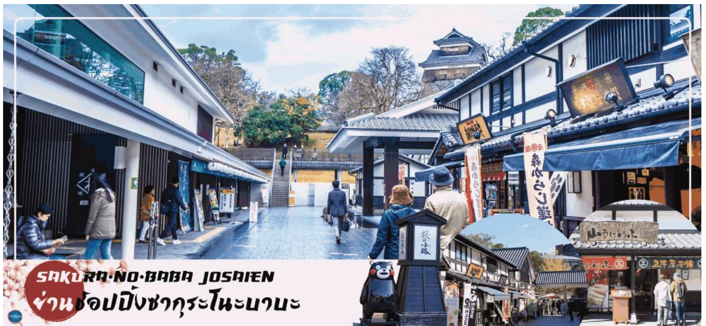
SAKURA-NO-BABA JOSHIEN ย่านช้อปปิ้งซากุระโนะบาระ

01.35 น. เhierฟ้าสู่ เมืองฟุกุโอกะ ประเทศญี่ปุ่น โดยเที่ยวบินที่ FD736