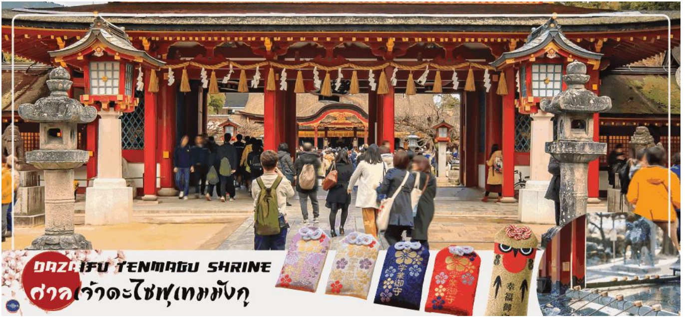
DAZAIFU TENMAGU SHRINE ศาลเจ้าตะไซฟูเทมมังกุ

จากนั้นเดินทางสู่ เมืองฟุกุโอกะ (Fukuoka) (ใช้เวลาเดินทางประมาณ 2 ชั่วโมง) เป็นเมืองที่ใหญ่ที่สุดของเกาะคิวชู ประเทศญี่ปุ่น เป็นเมืองท่าที่สำคัญมานานหลายร้อยปี มีแหล่งท่องเที่ยวทางธรรมชาติ วัฒนธรรม ตลอดจนแหล่งช้อปปิ้ง และอาหารหลากหลาย เรียกว่าเป็นเมืองที่ครบครัน ทำให้เป็นที่นิยมของนักท่องเที่ยวจำนวนมาก