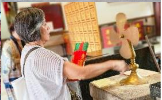
จากนั้นนำท่านเดินทางสู่ วัดหวังต้าเซียน (WONG TAI SIN TEMPLE) เป็นวัดเก่าแก่อายุกว่าร้อยปี (คน