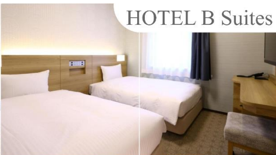
HOTEL B Suites