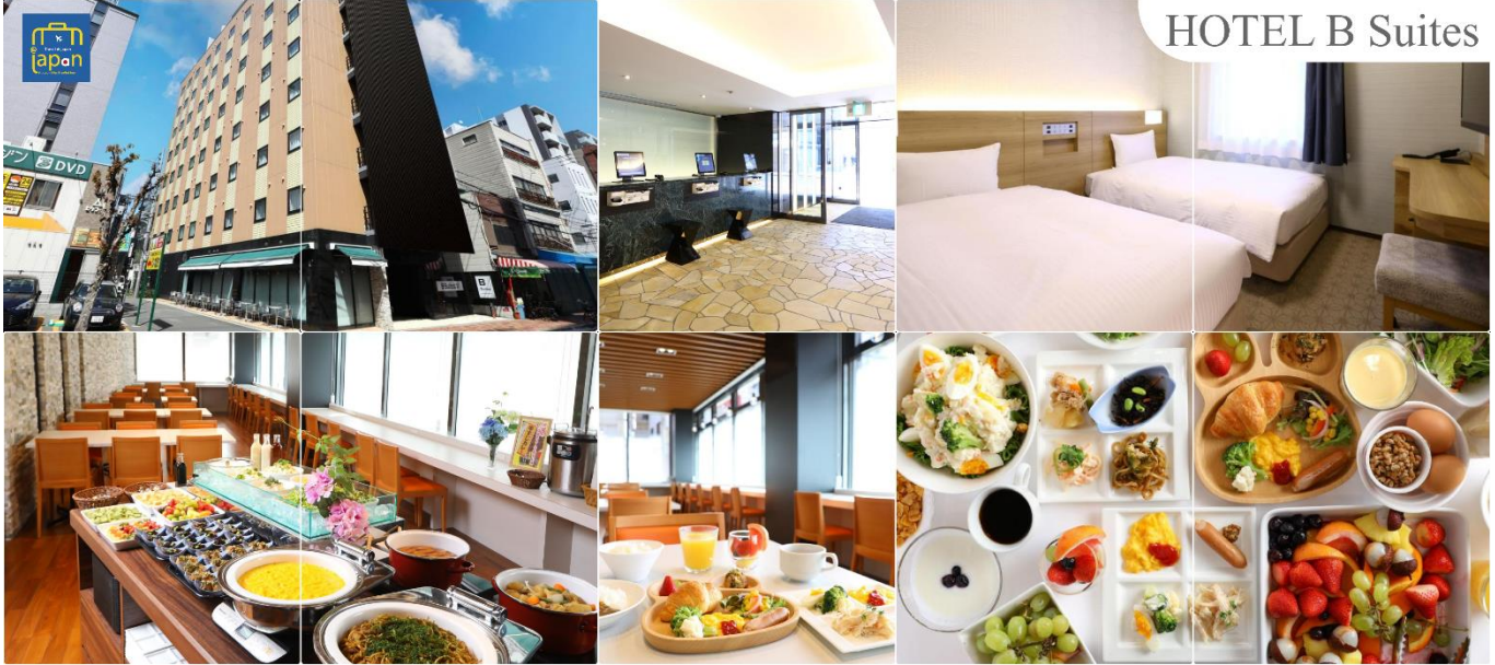
HOTEL B Suites

วันที่หก ท่าอากาศยานนานาชาติคันไซ โอซาก้า ประเทศญี่ปุ่น – ท่าอากาศยานสุวรรณภูมิ กรุงเทพฯ ประเทศไทย