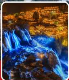
ฟูรงเจิน