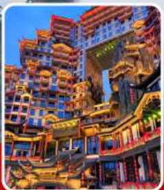
ตึก 72 ชั้น

อุทยานจางเจียเจีย เขาเทียนจื่อซาน สะพานหนึ่งในใต้หล้า ทะเลสาบเป่าเฟิงหู ตึกมหัศจรรย์ 72 ชั้น เมืองโบราณฟูรงเจิน เมืองโบราณฟิงหวง ล่องเรือแม่น้ำถิวเจียง สะพานสายรุ้ง ซุปปิ้ง ถนนคนเดินหลงซิงลู่