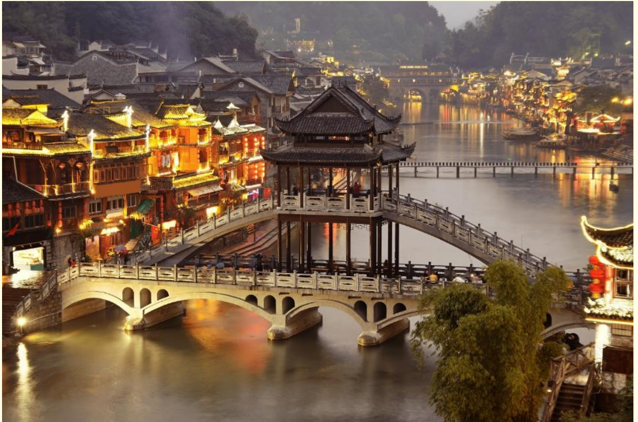
น้ำท่าชม สะพานสายรุ้ง สะพานไม้โบราณที่มีหลังคาคลุมเหมือนสะพานข้ามคลองในเวนิส สะพานแห่งนี้เคยเป็นด่านเก็บภาษีเกลือในสมัยราชวงศ์ชิง ซึ่งยังคงรักษารูปทรงในอดีตไม่เปลี่ยนแปลง