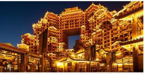
ตึก 72 ชั้น

*ทางบริษัทฯ ขอสงวนสิทธิ์ในการสลับโปรแกรมทัวร์ตามความเหมาะสมขึ้นอยู่กับสถานการณ์หน้างาน โดยคำนึงถึงผลประโยชน์ของลูกค้าเป็นสำคัญ