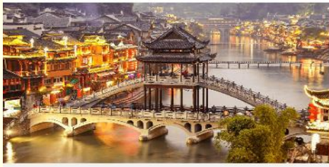
เมืองเฟิ่งหวง