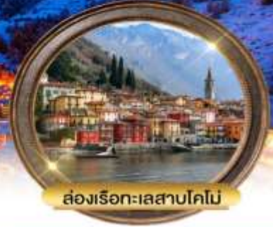
ล่องเรือทะเลสาบโคโม