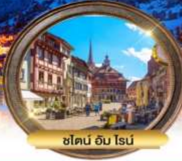
ชโดน์ อิม โรน