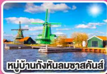
หมู่บ้านกังหันลมชาสคินส์