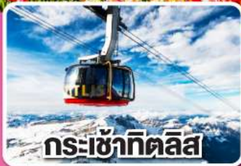
กระเช้าเทคิลิส