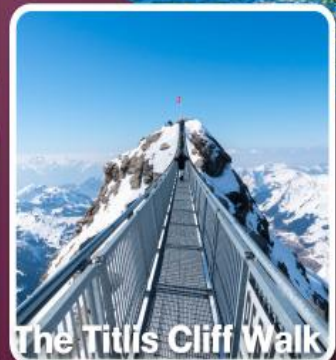
The Titlis Cliff Walk