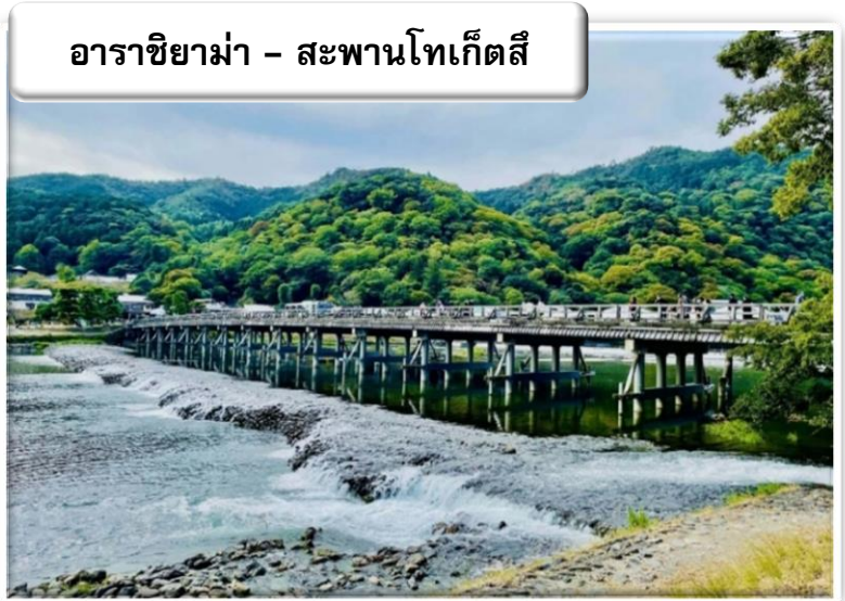
อาราชิยาม่า - สะพานโทเก็ตสึ

นำท่านเดินทางสู่ อาราชิยาม่า (Arashiyama) สถานที่สุดโรแมนติกที่แม้แต่ชาวญี่ปุ่นเองยัง มักจะไปเที่ยวพักผ่อนในวันหยุดเพื่อชื่นชมกับ ความสวยงามตามธรรมชาติ โดยเฉพาะอย่างยิ่ง ในช่วงฤดูใบไม้ผลิ การได้มาชื่นชมความสวยงาม ของดอกซากุระที่ได้รับการคัดเลือกให้เป็นหนึ่งใน สถานที่แนะนำสำหรับชมซากุระในเมืองเกียวโต สะพานโทเก็ตสึเคียว ที่มีความยาว 250 เมตร ข้ามแม่น้ำโออิงว่าตั้งอยู่บริเวณเชิงเขาอารา ชิยาม่าและยังคงลักษณะเหมือนในคริสต์ศตวรรษ