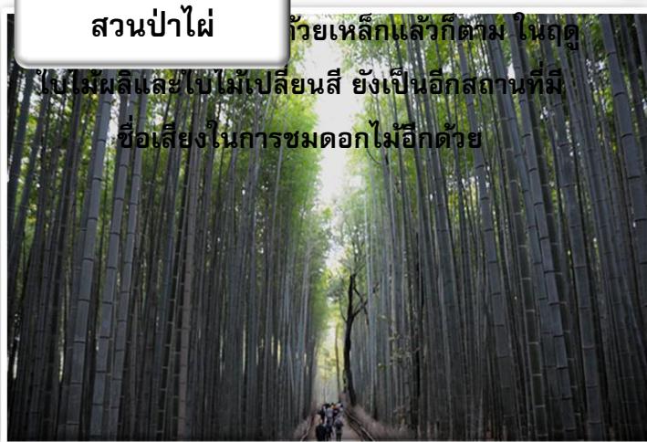
สวนป่าไผ่ ทั่วเหลือแล้วก็ตาม ในฤดู ใบไม้ผลิและใบไม้เปลี่ยนสี ยังเป็นอีกสถานที่มี ชื่อเสียงในการชมดอกไม้อีกด้วย

นำท่านเดินทางสู่ สวนป่าไผ่ (Bamboo Groves) เป็นเส้นทาง เดินเล็ก ๆ ที่ตัดผ่านในกลางสวนป่าไผ่ สามารถเดินเล่นหรือ ขี่จักรยานผ่านก็ได้ ให้บรรยากาศที่แปลกและหาได้ยาก อิสระให้ท่านเดินชมความงามยามที่มีแสงอาทิตย์ลอดผ่าน ตัวป่าไผ่ลงมายังพื้นด้านล่าง ประกอบกับมีลมพัดมาพร้อม กันก็จะเป็นเสียงกิ่งก้านของต้นไม้กระทบกันไปมา ดู สวยงามและให้บรรยากาศโรแมนติกยิ่งนัก บริเวณใกล้ ๆ จะเป็นร้านขายของพื้นเมืองที่ทำมาจากต้นไม้ เช่น ตะกร้า ไม้ไผ่, ถ้วย, กล่องใส่ของ หรือเสื่อสานจากไผ่ อิสระให้ท่าน ซื้อสินค้า หรือเลือกถ่ายภาพเก็บความประทับใจตาม