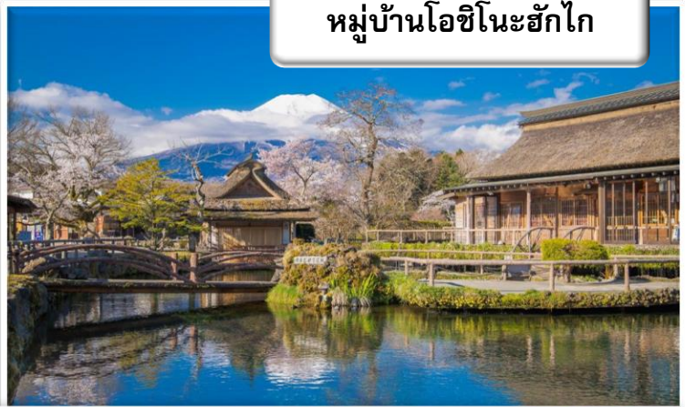
หมู่บ้านโอชิโนะฮักไก

หมู่บ้านโอชิโนะ ฮักไก (Oshino Hakkai Village) เป็นหมู่บ้านที่ตั้งอยู่ใกล้ภูเขาไฟฟูจิ บริเวณทะเลสาบยามานาคาโกะ (Lake Yamanakako) ซึ่งในปี 2013 ภูจิซังได้รับเลือกให้เป็นมรดกทางวัฒนธรรมของโลก ที่นี้เองก็ได้รับเลือกในฐานะส่วนหนึ่งของฟูจิซังด้วย และเพราะในบริเวณนี้มีบ่อน้ำใส ๆ รวมกันกว่า 8 บ่อ ทำให้คนไทยเราเรียกที่นี่ว่า "หมู่บ้านน้ำใส" นั่นเอง