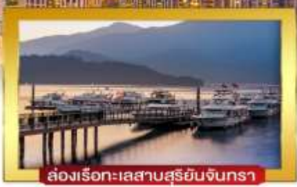
ล่องเรือทะเลสาบสุริยจันทร์