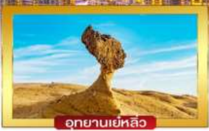
อุทยานเยลลิว