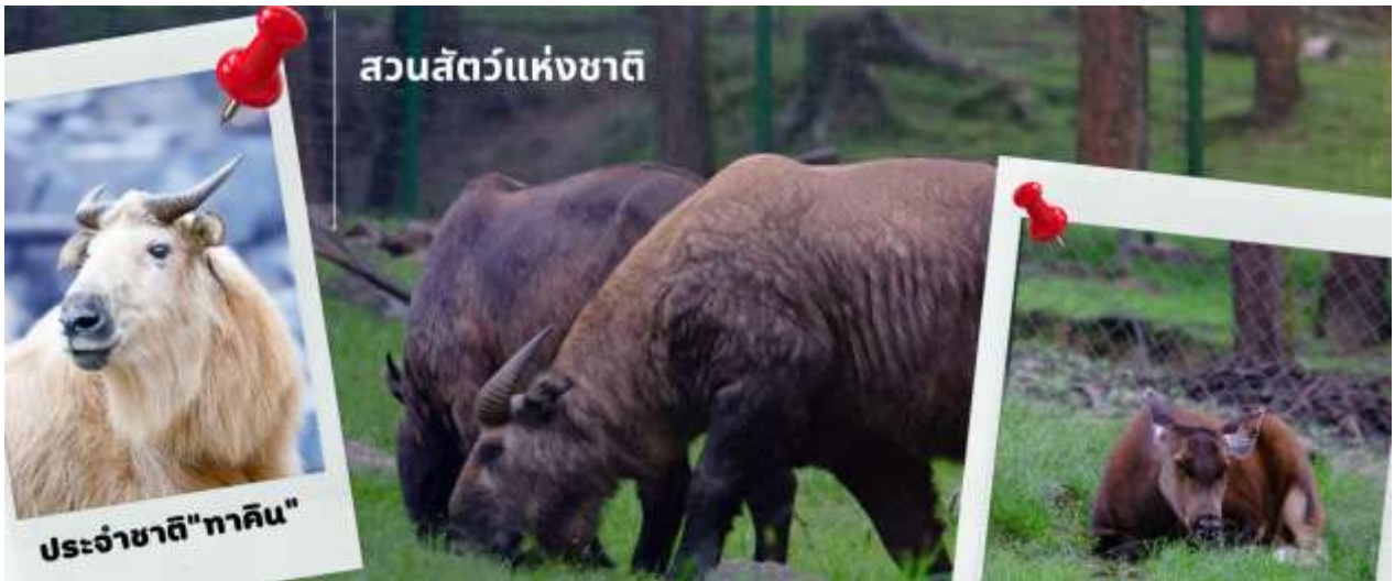
สวนสัตว์แห่งชาติ

เที่ยง รับประทานอาหารเที่ยง ณ ภัตตาคาร (มื้อที่ 7) นำท่านชม สวนสัตว์แห่งชาติของประเทศภูฏาน และชมสัตว์ประจำชาติ ทาคิน ที่มีรูปร่างลักษณะพิเศษผสมระหว่างแพะกับวัว มีแห่งเดียวในประเทศภูฏานเท่านั้น ซึ่งครั้งหนึ่งประเทศสหรัฐอเมริกาเคยเจรจาออกไปเลี้ยงแต่ได้รับการปฏิเสธจากรัฐบาลประเทศภูฏาน ทาคิน เป็นสัตว์ในตำนานประวัติศาสตร์ของศาสนาพุทธ โดยเชื่อว่าท่านลามะ Drukpa Kunley เป็นผู้สร้างขึ้นจากกระดูกของแพะและวัวที่ท่านได้ท่านเป็นอาหาร กอกระดูกก็กลับมามีชีวิตอีกครั้งกลายเป็น ตัวทาคิน ที่มีลักษณะคล้ายกับแพะและวัวผสมกัน