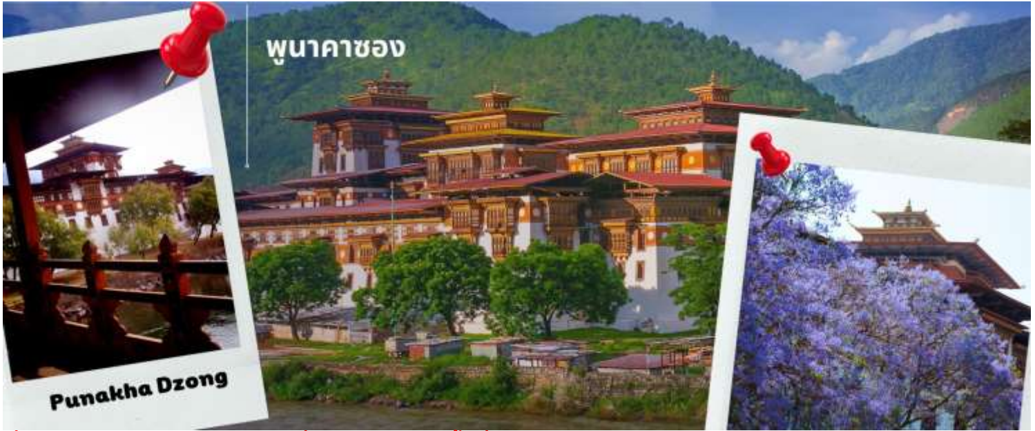
พุนาคาซอง