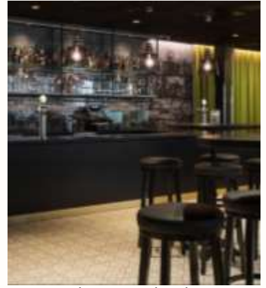
Thon Hotel Oslo Airport