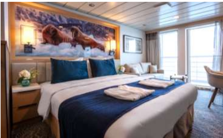
นำท่านเช็คอิน

เช็คอินลงเรือ Ocean Albatros เรือสำรวจลำใหม่ล่าสุดในเครือ Albatros Expeditions ที่ออกสู่ท้องทะเลในปี2023 เป็นเรือที่มีความแข็งแรงและปลอดภัยขั้นสูงสุด สามารถล่องได้ทั้งบริเวณขั้วโลกเหนือ/ใต้ Arctic และAntarctica บนเรือมีพนักงานบริการกว่า100คน และไกด์ประจำเรือรวมถึงผู้เชี่ยวชาญในแต่ละสาขา สะดวกสบายด้วย Loungeบริการชา/กาแฟ และขนมต่างๆ , ห้องอาหารนานาชาติ, ห้องบรรยาย, ห้องออกกำลังกาย, สระว่ายน้ำ, ดาดฟ้าสำหรับทำกิจกรรมต่างๆ อีกทั้งมีเรือ Zodiacs เรือยางขนาดย่อมที่จะพาท่านท่องเที่ยวกรีนแลนด์อย่างใกล้ชิดและเป็นมิตรกับธรรมชาติ ห้องพักรับรองแบบอย่างทันสมัย มีห้องน้ำในตัว สิ่งอำนวยความสะดวกที่จำเป็นภายในเรือ