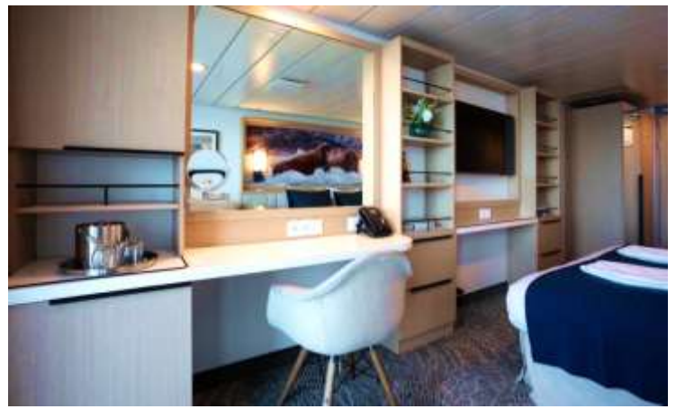
แนะนำส่วนต่างๆบนเรือ และซักซ้อมการปฏิบัติตัวบนเรือ

เช็คอินลงเรือ Ocean Albatros เรือสำรวจลำใหม่ล่าสุดในเครือ Albatros Expeditions ที่ออกสู่ท้องทะเลในปี2023 เป็นเรือที่มีความแข็งแรงและปลอดภัยขั้นสูงสุด สามารถล่องได้ทั้งบริเวณขั้วโลกเหนือ/ใต้ Arctic และAntarctica บนเรือมีพนักงานบริการกว่า100คน และไกด์ประจำเรือรวมถึงผู้เชี่ยวชาญในแต่ละสาขา สะดวกสบายด้วย Loungeบริการชา/กาแฟ และขนมต่างๆ , ห้องอาหารนานาชาติ, ห้องบรรยาย, ห้องออกกำลังกาย, สระว่ายน้ำ, ดาดฟ้าสำหรับทำกิจกรรมต่างๆ อีกทั้งมีเรือ Zodiacs เรือยางขนาดย่อมที่จะพาท่านท่องเที่ยวกรีนแลนด์อย่างใกล้ชิดและเป็นมิตรกับธรรมชาติ ห้องพักรับรองแบบอย่างทันสมัย มีห้องน้ำในตัว สิ่งอำนวยความสะดวกที่จำเป็นภายในเรือ