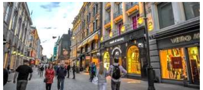
ถนนคาร์ล โยฮันส์ เกท KARL JOHANS GATE

ถนนคาร์ล โยฮันส์ เกท (Karl Johans Gate) ถนนสายช้อปปิ้งที่มีชีวิตชีวา และมีชื่อเสียงที่สุดแห่งหนึ่งของออสโลมีทั้งร้านค้าร้านอาหารมากมายตั้งอยู่บนถนนเส้นนี้ ให้เวลาท่านได้อิสระ