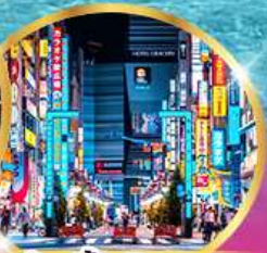
ช้อปปิ้งชินจุกุ