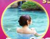
ฟัทออนเซ็น 1 คืน