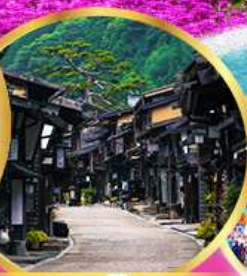
นาราจุกุ