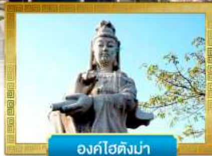
องค์โฮตังม่า