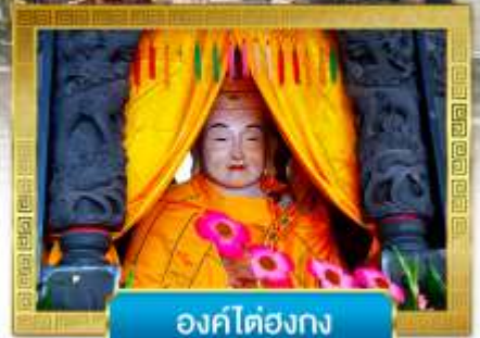
องค์ไตฮองกง