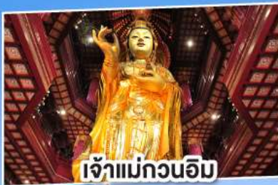
เจ้าแม่กวนอิม