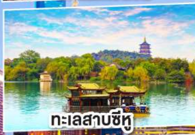
ทะเลสาบซีหู