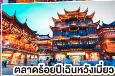
ตลาดร้อยปีเงินหวังเหมียว