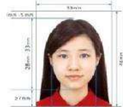
Paper Photo for Visa Application Form