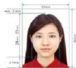
Paper Photo for Visa Application Form