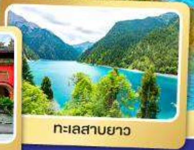
ทะเลสาบยาว