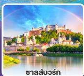
ซาลส์บวร์ค

ขึ้นรถไฟสายโรแมนติก เบอร์นินา เอ็กซ์เพรส ชมวิวตระการตาของสวิส