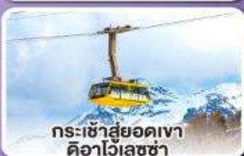
กระเช้าสู่ยอดเขา ดิอาไวเลซซา