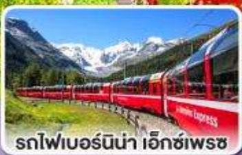
รถไฟเบอร์นินา เอ็กซ์เพรส