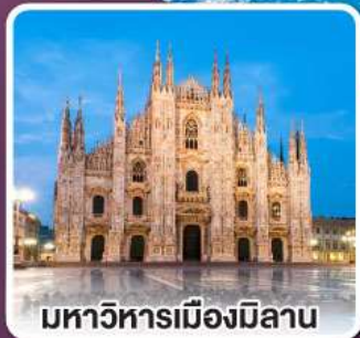
มหาวิหารเมืองมิลาน