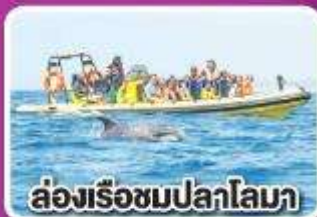
ล่องเรือชมปลาโลมา