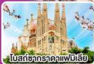
โบสถ์ซากราตาฟาเมียลีย