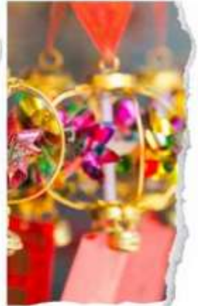
วัดแขกหมิว

นำท่านขอพรเพื่อเป็นสิริมงคล วัดแห่งนี้เป็นวัดที่คนฮ่องกงให้การเคารพนับถือเป็นอย่างมาก เป็นวัดเก่าแก่และมีชื่อเสียงที่สุดวัดหนึ่งของฮ่องกง เป็น 1 ในวัดของฮ่องกงที่ทุกท่านห้ามพลาดเลยก็เดียว