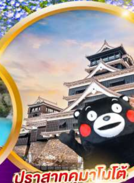
ปราสาทคามาโอบโด้