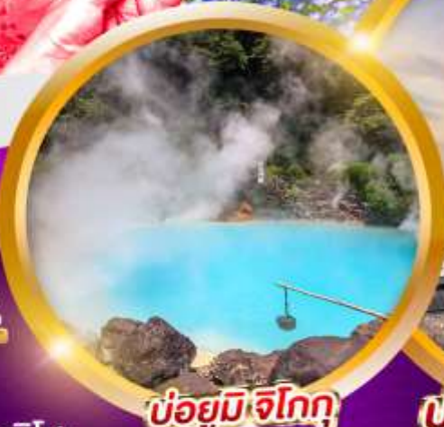
บ่อยมึจิโกกุ