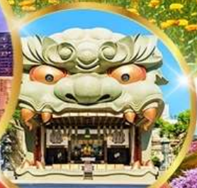
ศาลเจ้านิมะ ยาชากะ