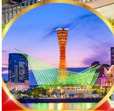
เมืองโกเบ