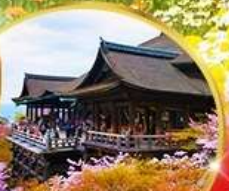
วัดคิโยมิจิ

UNIVERSAL STUDIOS JAPAN อิสระท่องเที่ยว 1 วันเต็ม วันอิสระเลือกชื่อ "Universal studio"