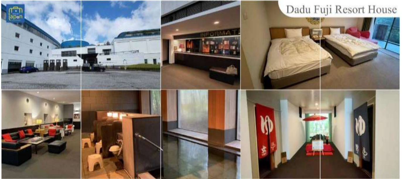
Dadu Fuji Resort House

หลังอาหารให้ท่านได้ผ่อนคลายกับการแช่น้ำแร่ธรรมชาติ เชื่อว่าถ้าได้แช่น้ำแร่แล้ว จะทำให้ ผิวพรรณสวยงามและช่วยให้ระบบหมุนเวียนโลหิตดีขึ้น