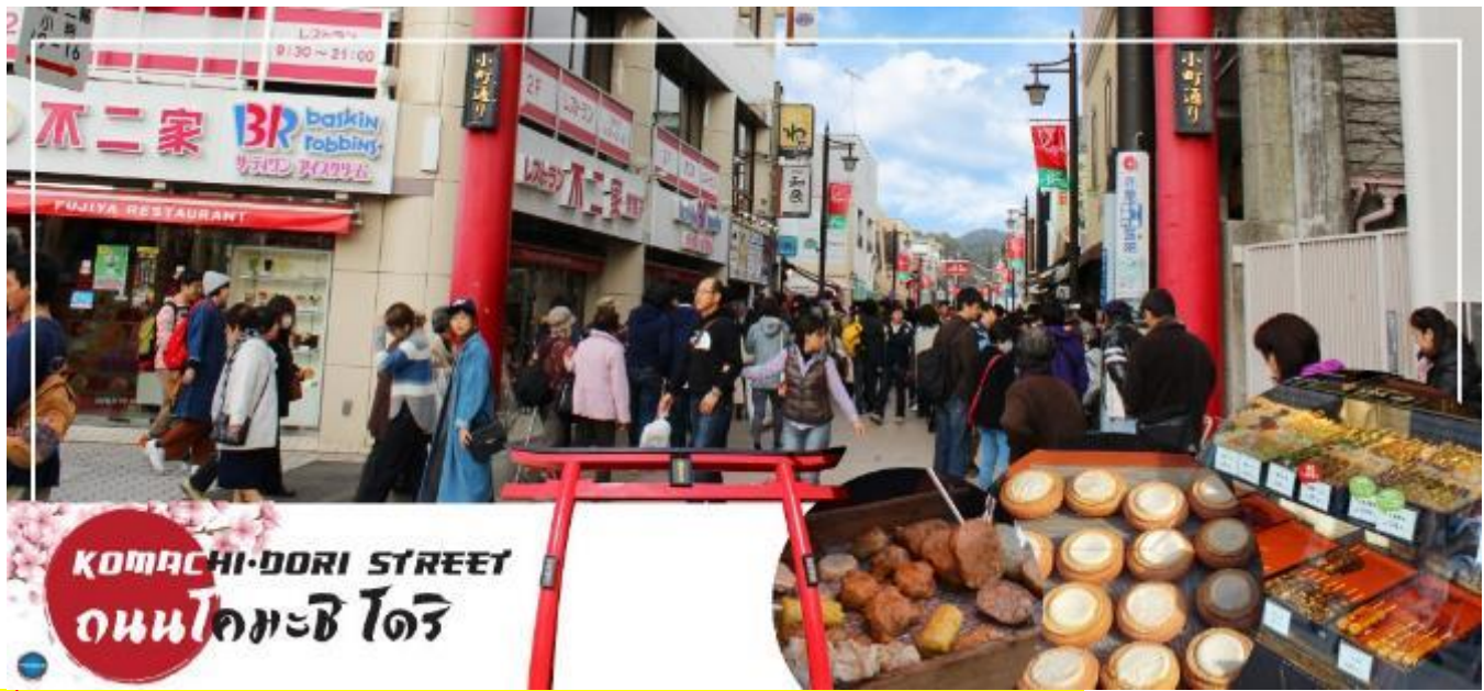
เที่ยง อิสระรับประทานอาหารกลางวันตามอัธยาศัย ณ ถนนโคมาจิโดริ

จากนั้นนำท่านท่านเดินสู่ ถนนโคมาจิโดริ (Komachi Dori Street) (ใช้เวลาเดินทางประมาณ 15 นาที) ตลอดระยะทางราวๆ 350 เมตรของถนนโคมาจิโดรินี้ เต็มไปด้วยร้านค้าละลานตา กว่า 250 ร้าน ไม่ว่าจะเป็นร้านอาหารท้องถิ่น ร้านขายของที่ระลึก ร้านเช่ากิโมโน คาเฟ่แสนน่ารัก ร้านหนังสือ สินค้าทำมือ ขนมญี่ปุ่นโบราณที่หากินได้ยากจากที่อื่น ร้านค้าส่วนมากยังอนุรักษ์รูปแบบอาคารดั้งเดิม ให้ความรู้สึกราวกับเดินในเมืองเก่าของญี่ปุ่น ร้านค้าบางส่วนก็ปรับปรุงเปลี่ยนแปลงตามยุคสมัย