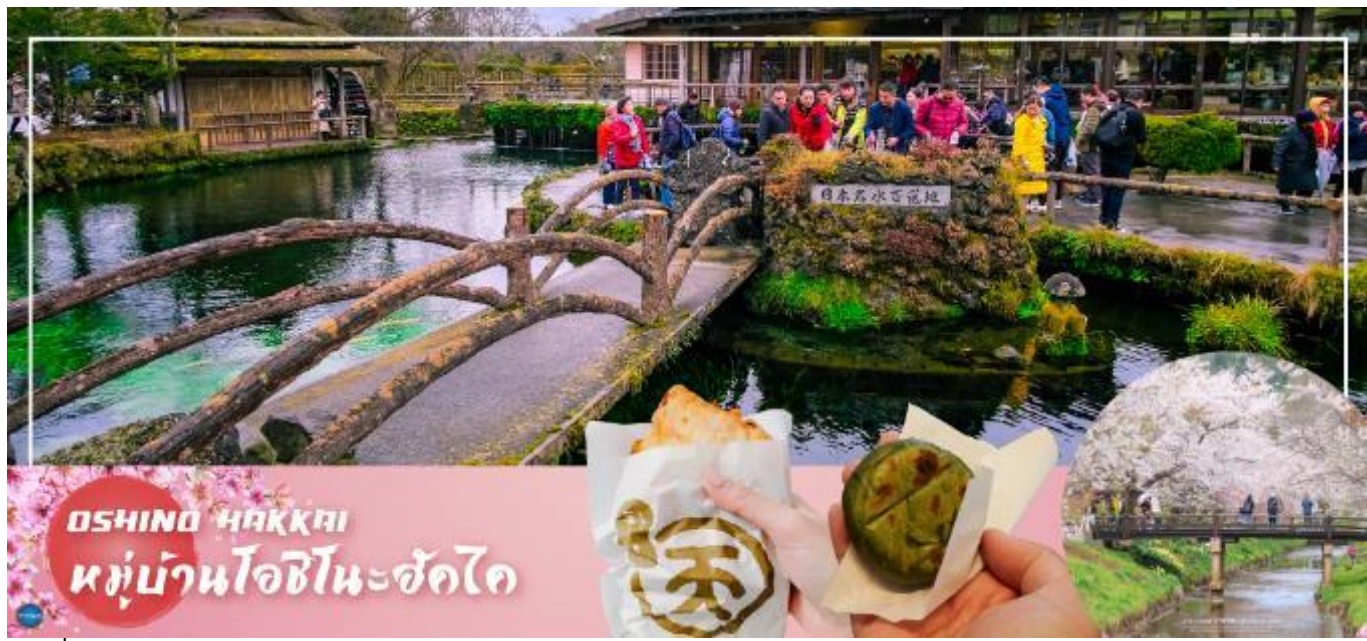
OSHINO HAKKAI หมู่บ้านโอชิโนะฮัคไค

นำท่านเดินทางสู่ หมู่บ้านโอชิโนะฮัคไค (Oshino Hakkai) ให้ท่านเจาะลึกตามหาแหล่งน้ำบริสุทธิ์จากภูเขาไฟฟูจิ ที่เป็นแหล่งน้ำตามธรรมชาติตั้งอยู่ในหมู่บ้านโอชิโนะ จ.ยามานาชิ หรือพูดในทางกลับกันคือกลุ่มน้ำผุดโอชิโนะฮัคไค เพียงก้าวแรกที่ย่างเท้าเข้าไปในหมู่บ้านก็สัมผัสได้ถึงอากาศบริสุทธิ์ และไอเย็นจากแหล่งน้ำธรรมชาติที่มีให้เห็นอยู่ทุกมุม โดยในบ่อน้ำใสแจ๋วมีปลาหลากหลายพันธุ์แหวกว่ายอย่างสบายอารมณ์ แต่ขอบอกเลยว่าน้ำแต่ละบ่อนั้นเย็นจับใจจนแอบสงสัยว่าน้องปลาไม่หนาวสะท้านกันบ้างหรือ เพราะอุณหภูมิในน้ำเฉลี่ยอยู่ที่ 10-12 องศาเซลเซียส นอกจากชมแล้วก็ยังมิน้ำผุดจากธรรมชาติให้ดื่มตามอัธยาศัย และที่สำคัญ หมู่บ้านโอชิโนะยังเป็นแหล่งช้อปปิ้งสินค้าโอท็อปชั้นเยี่ยมอีกด้วย