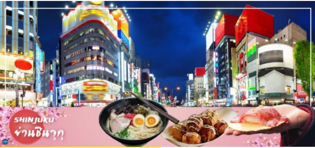
เย็น อิสระรับประทานอาหารเย็นตามอัธยาศัย ได้เวลาอันสมควรนำท่านเดินทางสู่ เมืองนาริตะ (ใช้เวลาเดินทางประมาณ 1 ชั่วโมง)

นำท่านช้อปปิ้ง ย่านชินจูกุ (Shinjuku) ให้ท่านอิสระและเพลิดเพลินกับการช้อปปิ้งสินค้ามากมาย ทั้งเครื่องใช้ไฟฟ้า กล้องถ่ายรูปดิจิตอล นาฬิกา เครื่องเล่นเกม หรือสินค้าที่จะเอาใจคุณผู้หญิงด้วย กระเป๋า รองเท้า เสื้อผ้า แบรินด์เนม เสื้อผ้าแฟชั่นสำหรับวัยรุ่น เครื่องสำอางยี่ห้อดังของญี่ปุ่นไม่ว่าจะเป็น KOSE, KANEBO, SK II, SHISEDO และอื่นๆ อีกมากมาย ห้ามพลาด!!! จุดเช็คอินแห่งใหม่ ของชาวโซเชียล นั่นก็คือ แมวยักษ์ 3 มิติ ที่โพลันจอลแอลอีดีมีขนาดมหึมา จมมีความโค้งขนาด 154 ตารางเมตร (1,664 ตารางฟุต) เสียงที่ออกจากลำโพงคุณภาพเกรดดี ความละเอียดภาพระดับ 4K ถือเป็นเทคโนโลยีระดับสูง ที่ให้ภาพเสมือนจริงปรากฏเป็นภาพแมวเหมียวเดินเล่นไปมาอยู่เหนือกรุงโตเกียว นอกจากแมวยักษ์แล้ว ท่านยังสามารถรับชมโฆษณาต่างๆ ที่ถูกครีเอทให้เป็นภาพ 3 มิติ ผ่านจอแอลอีดีนี้ ไม่ว่าจะเป็น แพนด้า, รองเท้าไนกี้, น้องหมา Pompompurin, จานบิน UFO แม้แต่หุ่นยนต์เครื่องดูดฝุ่น ท่านสามารถรับชมและเก็บภาพได้ตามอัธยาศัย