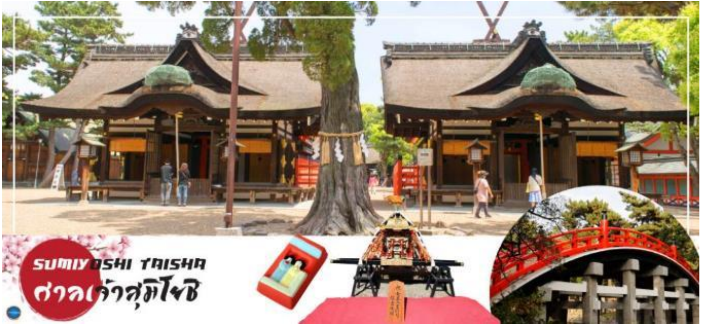
SUMIYOSHI TAISHA ศาลเจ้าสุมิโงชิ

จากนั้นนำท่านสู่ย่าน หมู่บ้านอเมริกา มุระ (America Mura) (ใช้เวลาเดินทางประมาณ 20 นาที) หรือที่คนญี่ปุ่นเรียกกันอย่างติดปากกว่า อะเมะมุระ นับเป็นย่านวัยรุ่นที่รวมเอาร้านค้าแฟชั่น สไตส์ตะวันตกเหมือนยกอเมริกามาไว้ในโอซาก้าเป็นย่านที่มีชาวต่างชาติโดยเฉพาะชาวตะวันตกให้เห็นอย่างอุ้นหนาผาดังไม่น้อยไปกว่าคนญี่ปุ่นเจ้าถิ่นแพชั่นการแต่งตัวของวัยรุ่นที่มาเดินในย่านนี้ถือได้ว่าเด็ดดวงไม่แพ้ย่านชินญาในโตเกียวเลย ทั้งยังเป็นที่ยินยอมมาแสวงค์เอาของเหล่าวัยรุ่นในช่วงวันหยุดสุดสัปดาห์ โดยจะมารวมตัวกันทำกิจกรรมซิคๆคูลๆอย่างการแสดงดนตรีสด การเต้นรำ โคะเวอร์ต่างๆ ไปจนถึงการแสดงแนวอาร์ตๆหลากหลายรูปแบบ