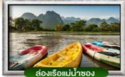
ส่องเรือแม่น้ำซอง