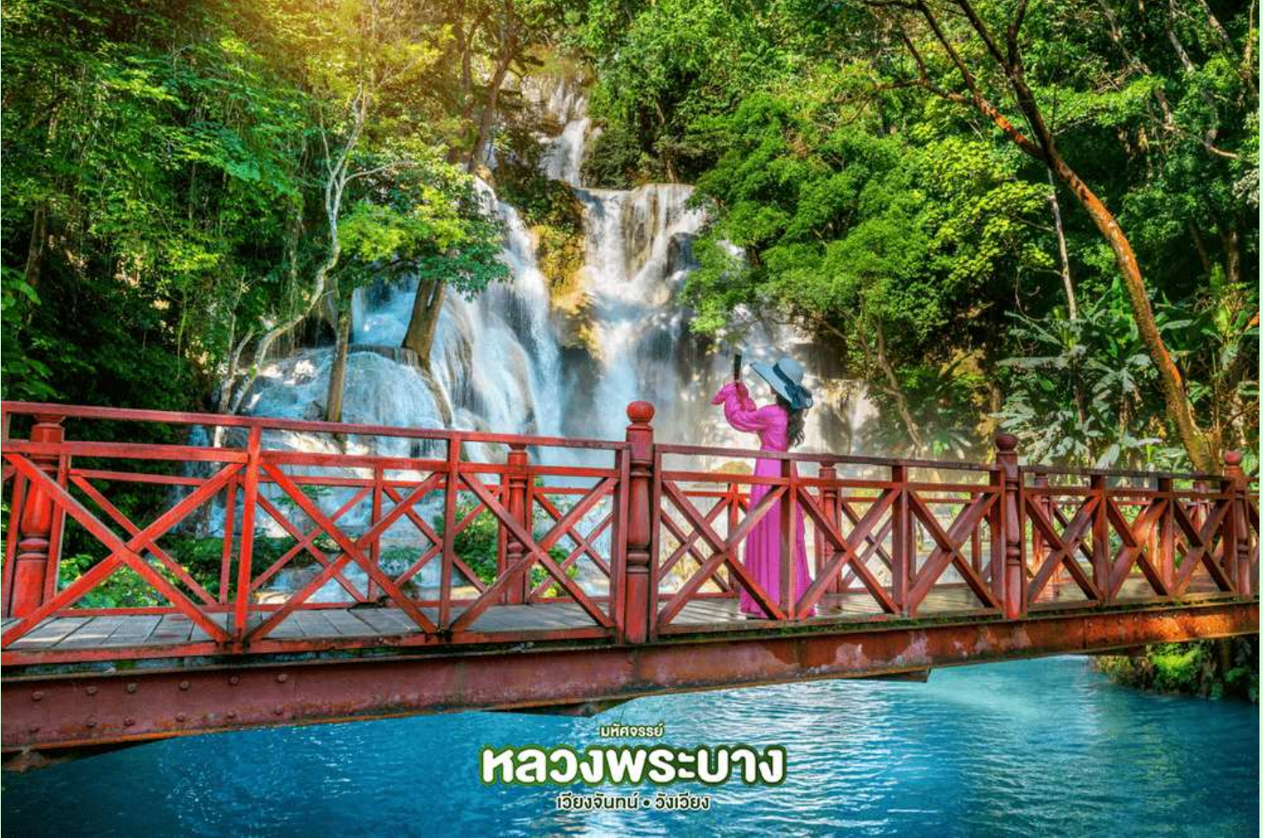
มหัศจรรย์ หลวงพระบาง เวียงจันทน์ • วังเวียง

จากนั้น นำเดินทางผ่านหมู่บ้านชนบทชมวิถีชีวิตของชาวบ้านสู่ น้ำตกตาดกวาสี (Kuang Xi Waterfall) โดยผ่านหมู่บ้านชนบทริมถนน 2 ข้างทาง เป็นหนึ่งในน้ำตกที่สวยงามที่สุดในเขตหลวงพระบาง มีแม่น้ำ ไสสีมรดกตลอดปี ชมความงามของน้ำตกที่ตกลงหลั่นเป็นชั้นๆ อย่างสวยงาม มีสะพานและเส้นทาง เดินชมรอบๆ น้ำตก ให้เวลาอิสระดื่มด่ำกับธรรมชาติ และ อิสระกับการเล่นน้ำ