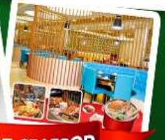
ก๊วยแม่น้ำ + HOTPOT SEAFOOD