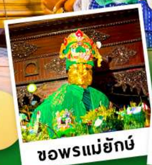
ขอพรแม่ย่า