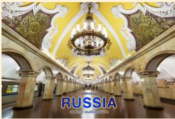
เดินทางสู่

สถานีรถไฟใต้ดินกรุงมอสโก (Moscow Metro) ชมความอลังการตื่นตาตื่นใจกับการผสมผสานระหว่างเทคโนโลยีกับสถาปัตยกรรมหลากหลายรูปแบบ เช่น การประดับด้วยกระจกสี เป็นต้น เดินทางต่อไปยัง ถนนอาร์บัต (Arbat Street) อยู่ในใจกลางของแหล่งประวัติศาสตร์ และถือว่าเป็นหนึ่งในย่านโบราณที่สุดของมอสโก ที่เต็มไปด้วยร้านอาหาร ร้านขายของที่ระลึก ร้านคาเฟ่ต่างๆ