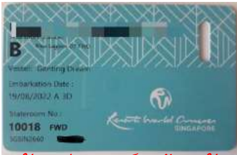
ตัวอย่างการ์ดห้องพัก