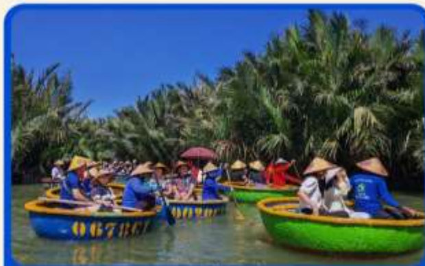
พิเศษ !!! นั่งเรือกระดัง UNSEEN เวียดนาม