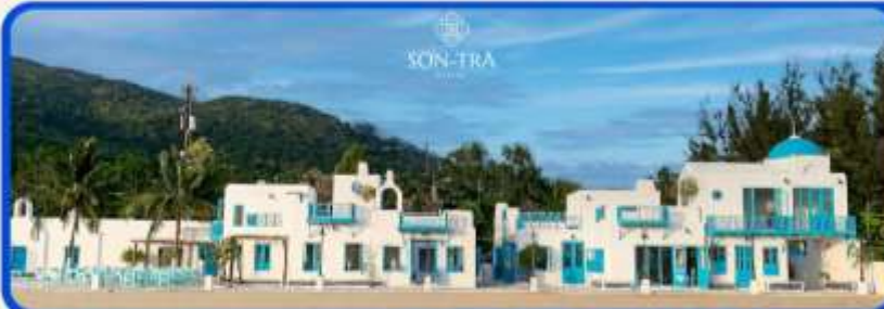
เช็คอินคาเฟ่ SON TRA MARINA