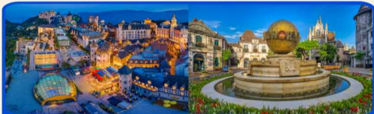
พักผ่อน บานาฮิลส์ 1 คืน