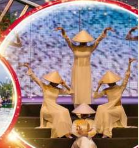
Charming Danang Show