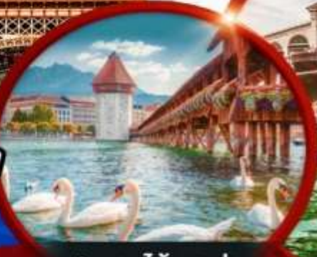
สะพานไม้ ชาเปล

รวมทุกอย่าง!! ไม่ต้องจ่ายค่านางาน วีซ่า ฟิลท้องถิ่น คิวประกันโรกรม หอพักส่วนตัว