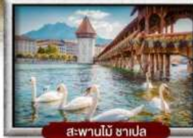
ส-พานโบ้ ซาเปลา