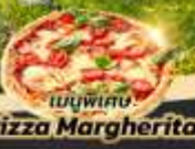
เมนูพิเศษ Pizza Margherita

นั่งรถไฟสายโรแมนติก Bernina Express มหาวีหารเซนต์กิลเลน ชมหมู่บ้านซานตา แมดดาเลนา วิหารโบลาซาโน St. Magdalena อุทยานมรดกโลกโดโลไมท์ Misurina Lake ทะเลสาบที่มีวิวเทือกเขาโดโลไมท์