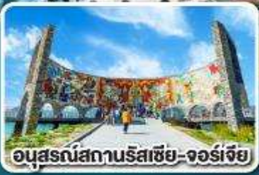
อนุสรณ์สถานรัสเซีย-จอร์เจีย