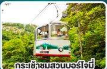
กระเช้าชมสวนบอร์โจมี