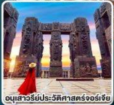
อนุสาวรีย์ประวัติศาสตร์จอร์เจีย

การ์นตี ห้องพักรีวิวที่เอกเขาคอเคซัส ที่โรงแรม ROOMS