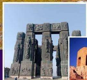
THE CHRONICLE OF GEORGIA