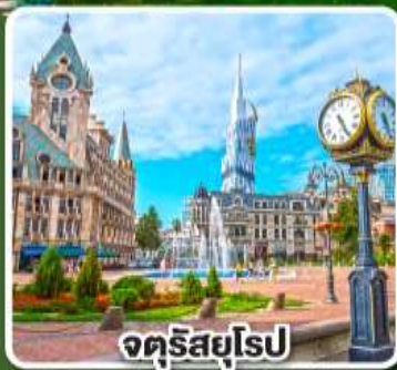
จัตุรัสยุโรป

การ์นต์ พักโรงแรม Rooms วิวเทือกเขาที่สวยงามอลังการ