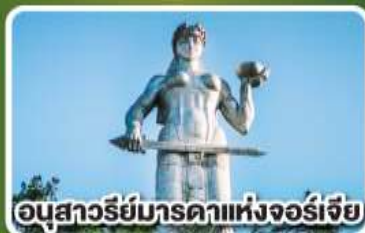
อนุสาวรีย์มารดาแห่งจอร์เจีย