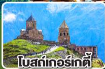
โบสถ์เกอร์เกตี