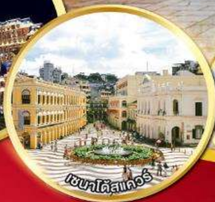
เซนต์มาร์คเวนิซ