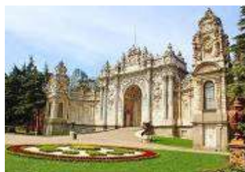
พระราชวังโดลมาบาเซ่