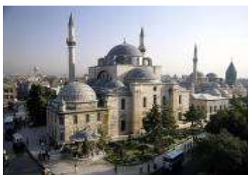
เมืองคอนย่า