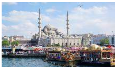
เมืองอิสตันบูล