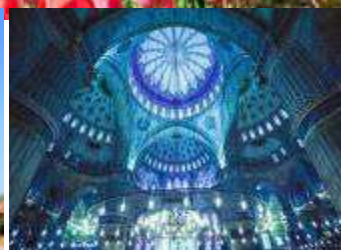
มัสยิดสีน้ำเงิน