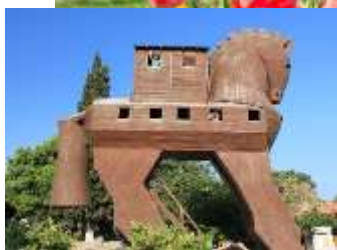
กรุงทรอย