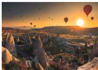
เมืองคัปปาโดเกีย