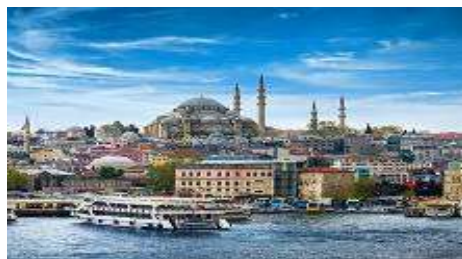
ล่องเรือช่องแคบบอสฟอรัส