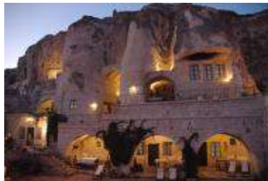
โรงแรมถ้ำ