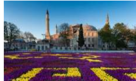
เทศกาลทิวลิป ณ กรุงอิสตันบูล