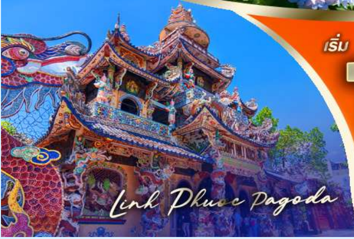
Link Phuoc Pagoda