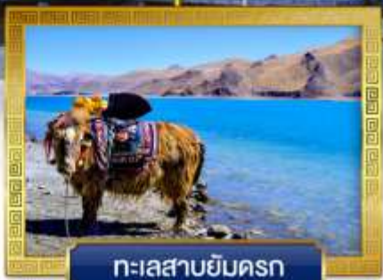
ทะเลสาบยัมดรก

เดินทางโดย: สายการบินลัคกี้แอร์ & โซน่อีสเทิร์นแอร์ไลน์