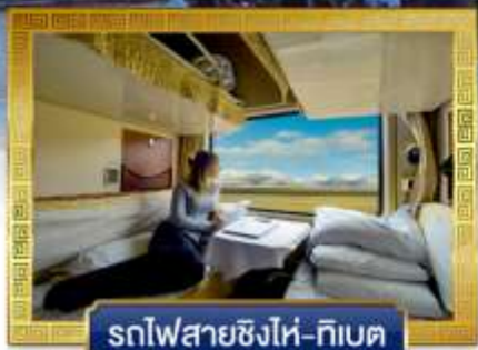
รถไฟสายชิงไห่-ทิเบต