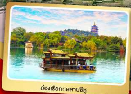
ล่องเรือทะเลสาบซีหู