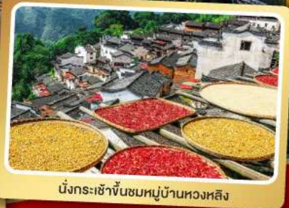
นั่งกระเช้าขึ้นชมหมู่บ้านหวงหลิง