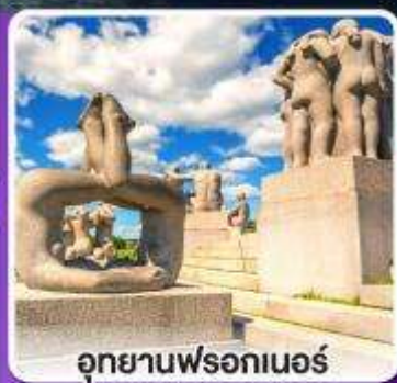
อุทยานฟรอกเนอร์