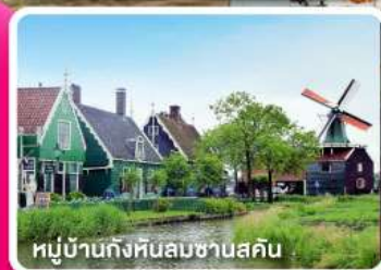
หมู่บ้านกังหันลมซานสคิน