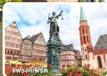
แฟรงค์เฟิร์ต