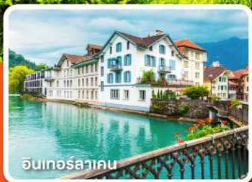
อินเทอร์สลาเคน