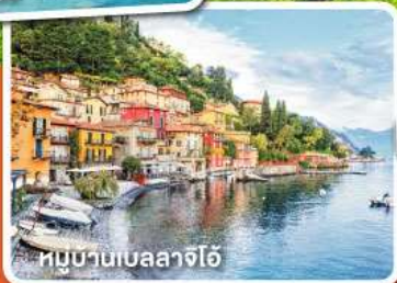
หมู่บ้านเบลลาจีโอ