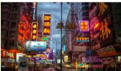
จิมซาจุ้ย