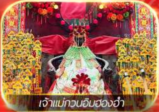
เจ้าแม่กวนอิมของอ่ำ