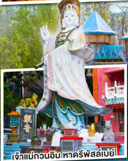
เจ้าแม่กวนอิม หาดริฟส์ลีย์